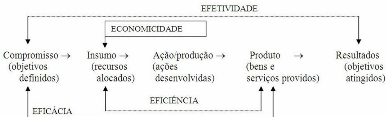
Diagrama de insumo-produto