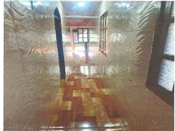
ÁREA DE CIRCULAÇÃO