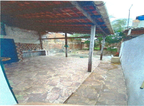
ÁREA DE SERVIÇO