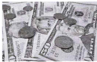
Dólar recua a R$ 5 e Bolsa de Valores fecha em forte alta

O barril WTI, utilizado nos EUA, recuou 5,58%, a US$ 98,32. Também no mercado internacional, os índices de Wall Street e europeus subiram. As Bolsas S&P 500, Dow Jones e Nasdaq tiveram altas de 0,98%, 1,30% e 1,54%, respectivamente, às expecta-