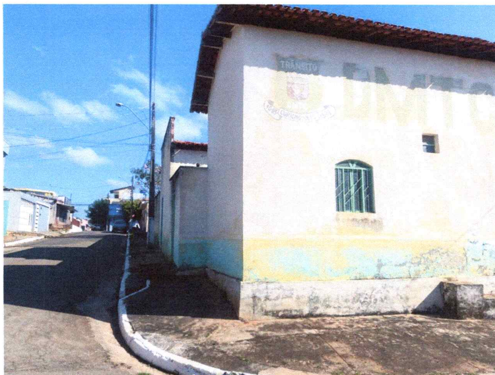
Figura 3 – Imagem lateral do imóvel.