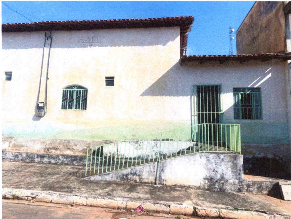
Figura 2 – Imagem frontal do imóvel.