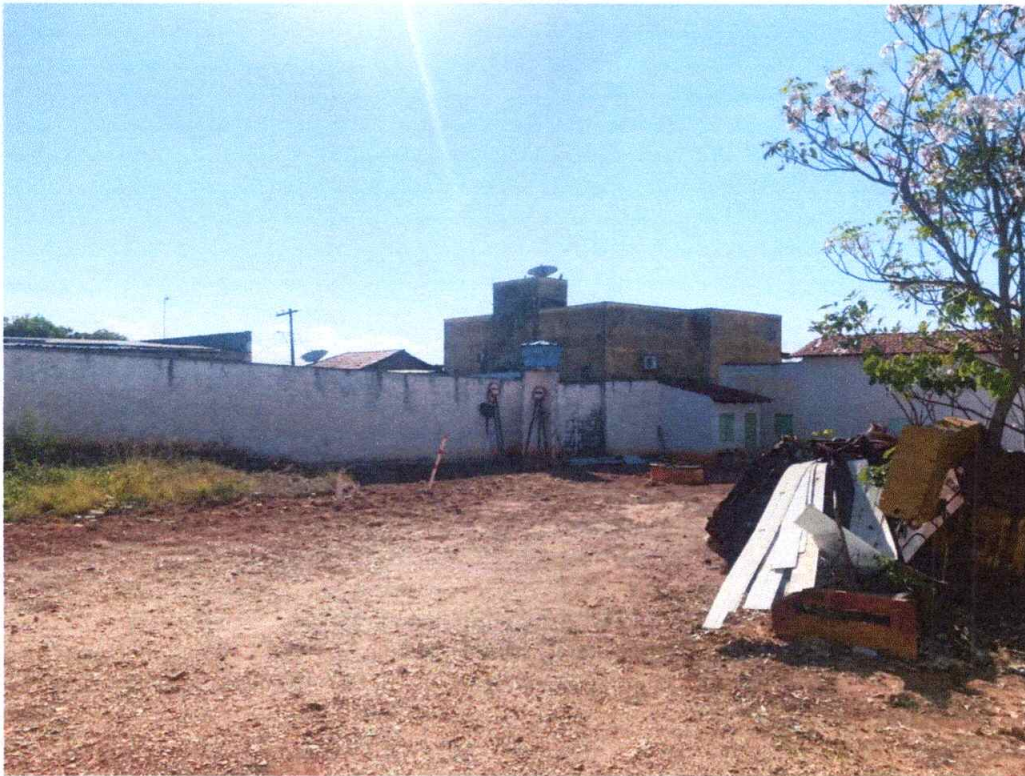
Figura 4 – Imagem da área externa do imóvel.