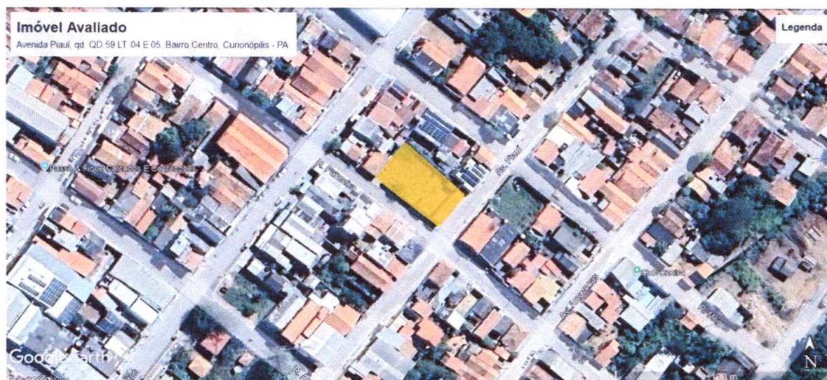
Figura 1 – Imagem da localização com base no Google Earth