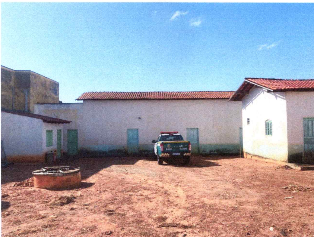
Figura 5 – Imagem do fundo do imóvel.