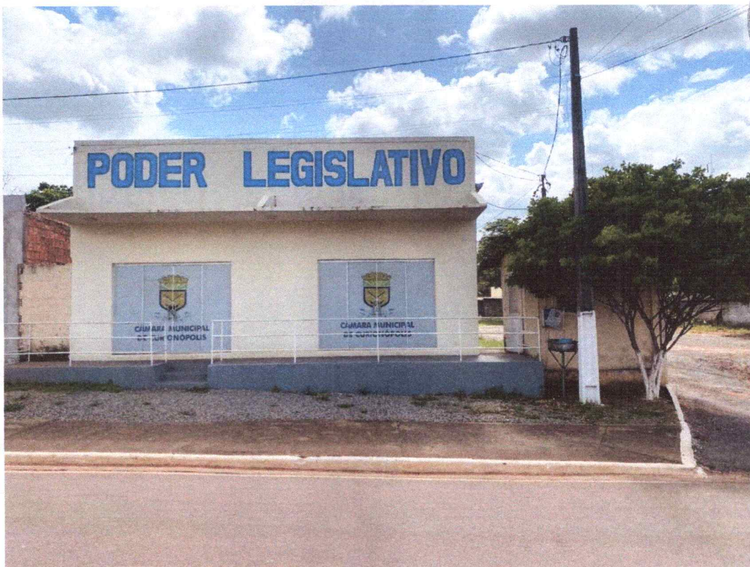
Figura 2 – Imagem frontal do imóvel comercial.