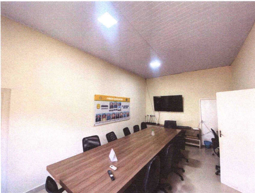
Figura 4 – Imagem da sala de reunião do imóvel.