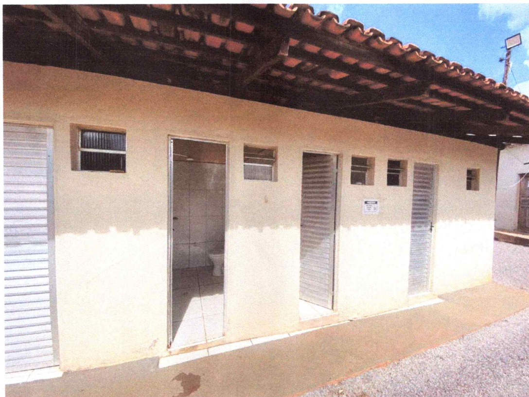
Figura 3 – Imagem dos banheiros externos.