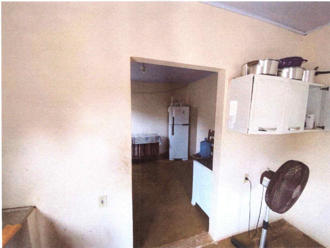
Figura 9 – imagem da cozinha.