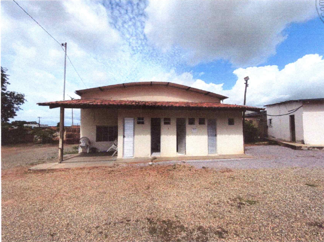
Figura 8 – Imagem do fundo externo do imóvel.