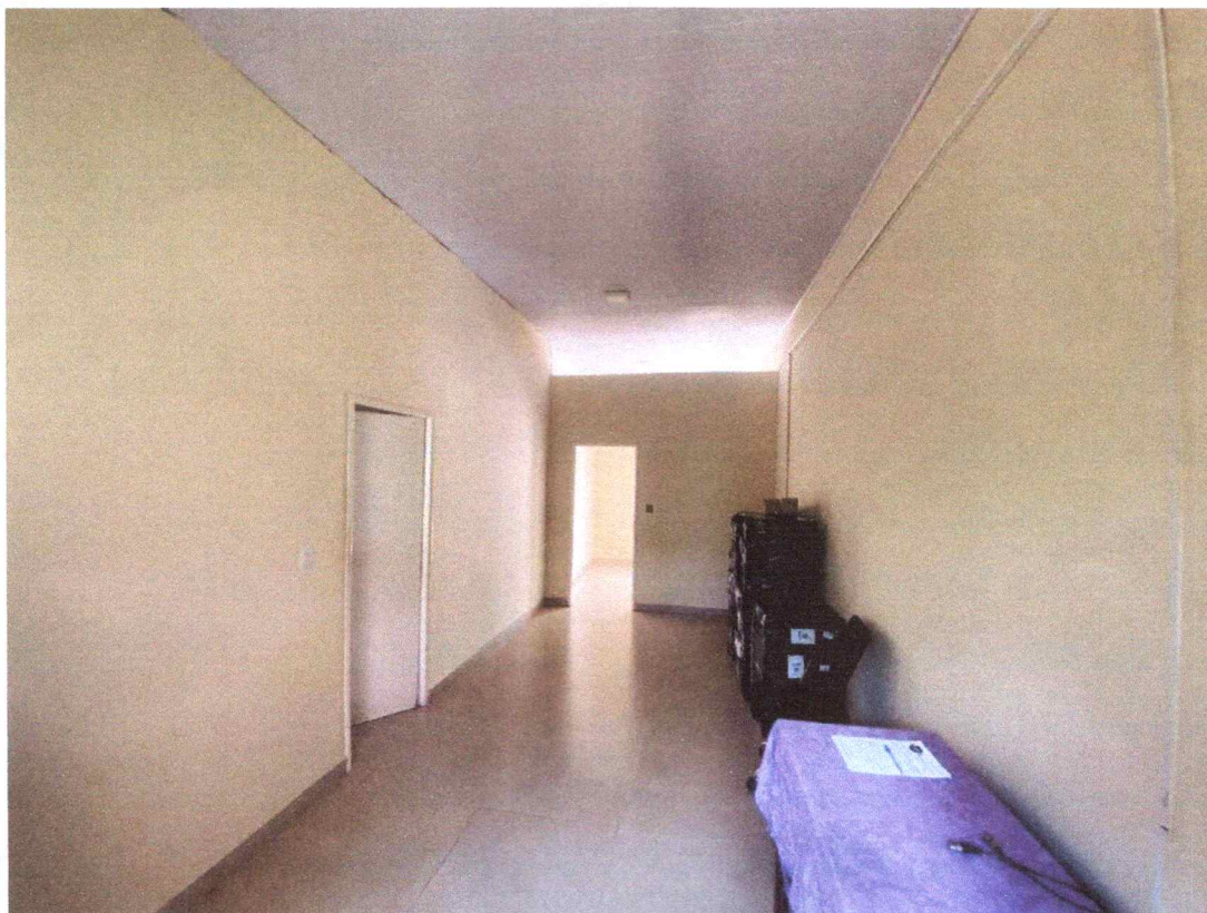
Figura 5 – Imagem do corredor de passagem.