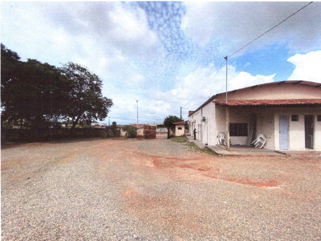
Figura 7 – Imagem lateral do imóvel.