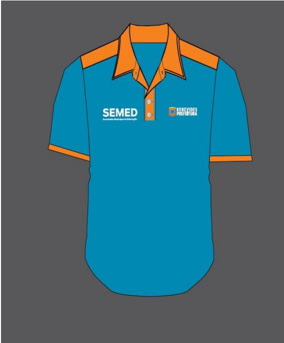
*MANIPULADOR DE ALIMENTOS E SERVIÇOS GERAIS*