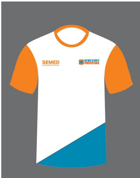
*AGENTE DE PORTARIA E VIGIA*