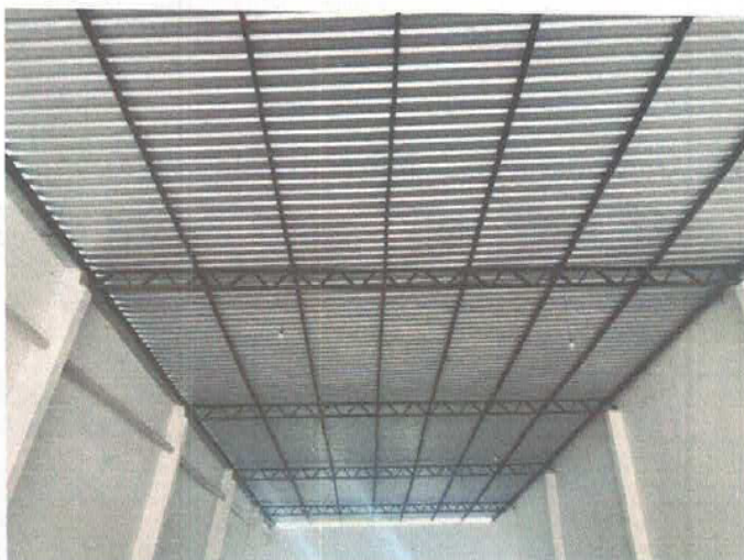
Imagem 04 – Parte interna da cobertura.