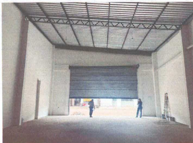
Imagem 02 – Área interna do galpão com vista para a porta de entrada.