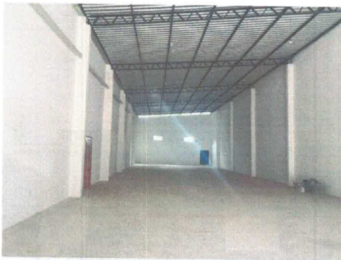
Imagem 03 – Área interna do galpão com vista para a parte posterior.