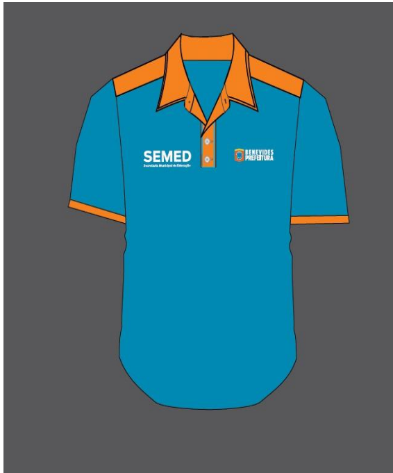
*MANIPULADOR DE ALIMENTOS E SERVIÇOS GERAIS*