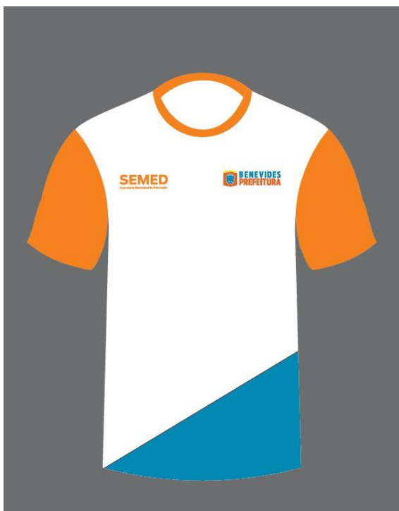
*AGENTE DE PORTARIA E VIGIA*