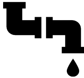
Coleta de esgoto