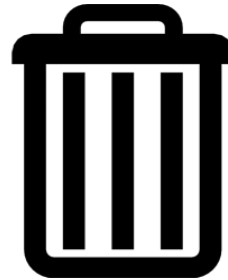
Coleta e tratamento de lixo