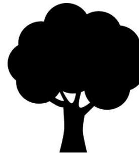
Arborização Urbana e Poda